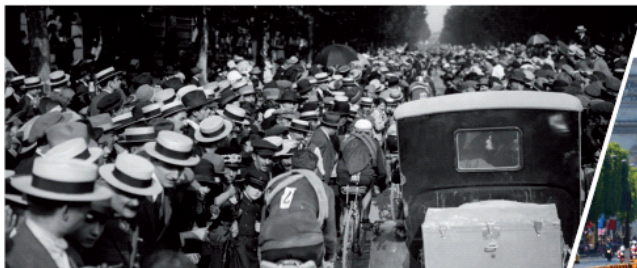
Île-de-France, 19 e étape Dunkerque - Paris (Paris des Princes) 22 juillet 1923. Le peloton dans Saint-Cloud.